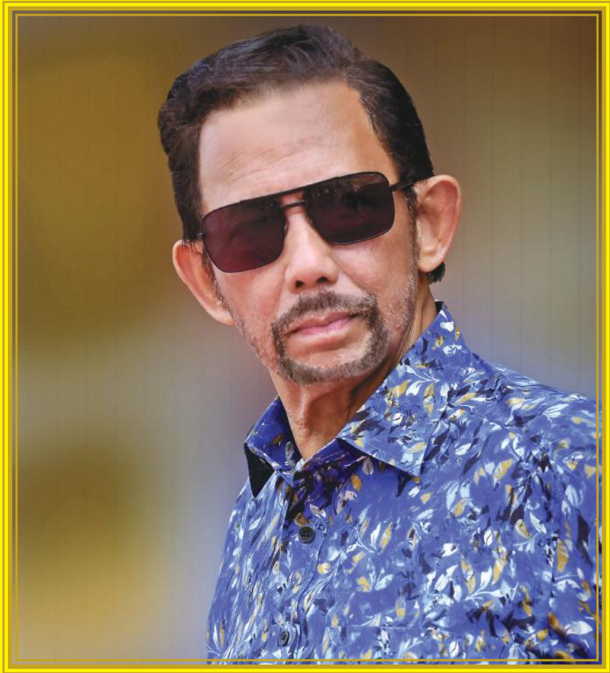
Kebawah Duli Yang Maha Mulia Paduka Seri Baginda Sultan Haji Hassanal Bolkiah Mu'izzaddin Waddaulah ibni Al-Marhum Sultan Haji Omar 'Ali Saifuddien Sa'adul Khairi Waddien, Sultan dan Yang Di-Pertuan Negara Brunei Darussalam